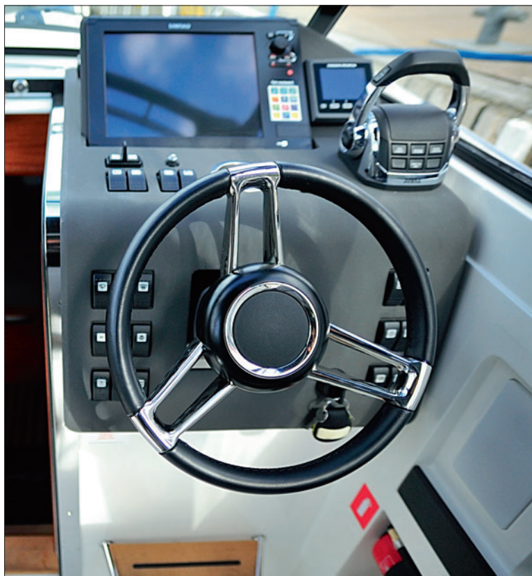
Preuve d'une certaine fonctionnalité, le poste de pilotage bénéficie d'une finition mate pour éviter les reflets.